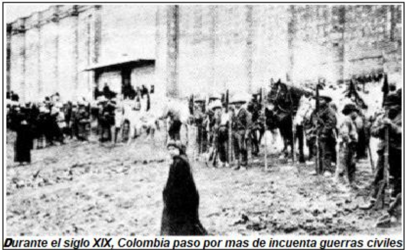
Durante el siglo XIX, Colombia paso por mas de incueta guerras civiles

Luego de fuertes enfrentamientos permiten la llegada al poder de los liberales, quienes inicialmente se mostraron unidos por sus intereses contrarios a los conservadores, pero con el paso de tiempo a lo largo de esos más de veinte años, se fueron diferenciando y separando hasta hacer irreconciliables sus ideas e intereses. En 1863 se consolida la Confederación granadina con un marcado federalismo y una carga de reformas políticas como las mencionadas dentro de las ideas liberales, pero también con reformas sociales y económicas que eliminan parcialmente la mayor parte de las ideas conservadoras de